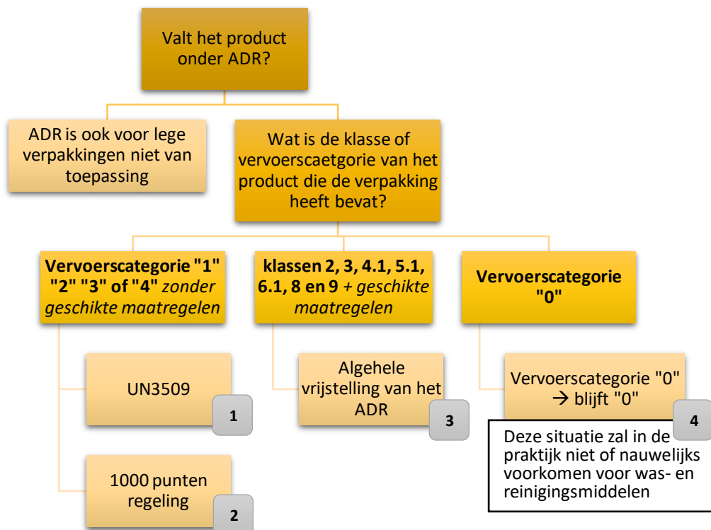
Figuur 1 Overzicht verschillende situaties voor vervoer lege verpakkingen

na gebruik buiten het ADR (zie ook figuur 1). Daarnaast kunnen lege ongereinigde verpakkingen die ADR geclassificeerde producten hebben bevat altijd onder dezelfde voorwaarden worden vervoerd als toen de verpakkingen nog vol waren (situatie 1 in figuur 1), bijvoorbeeld in het geval van LQ-producten.